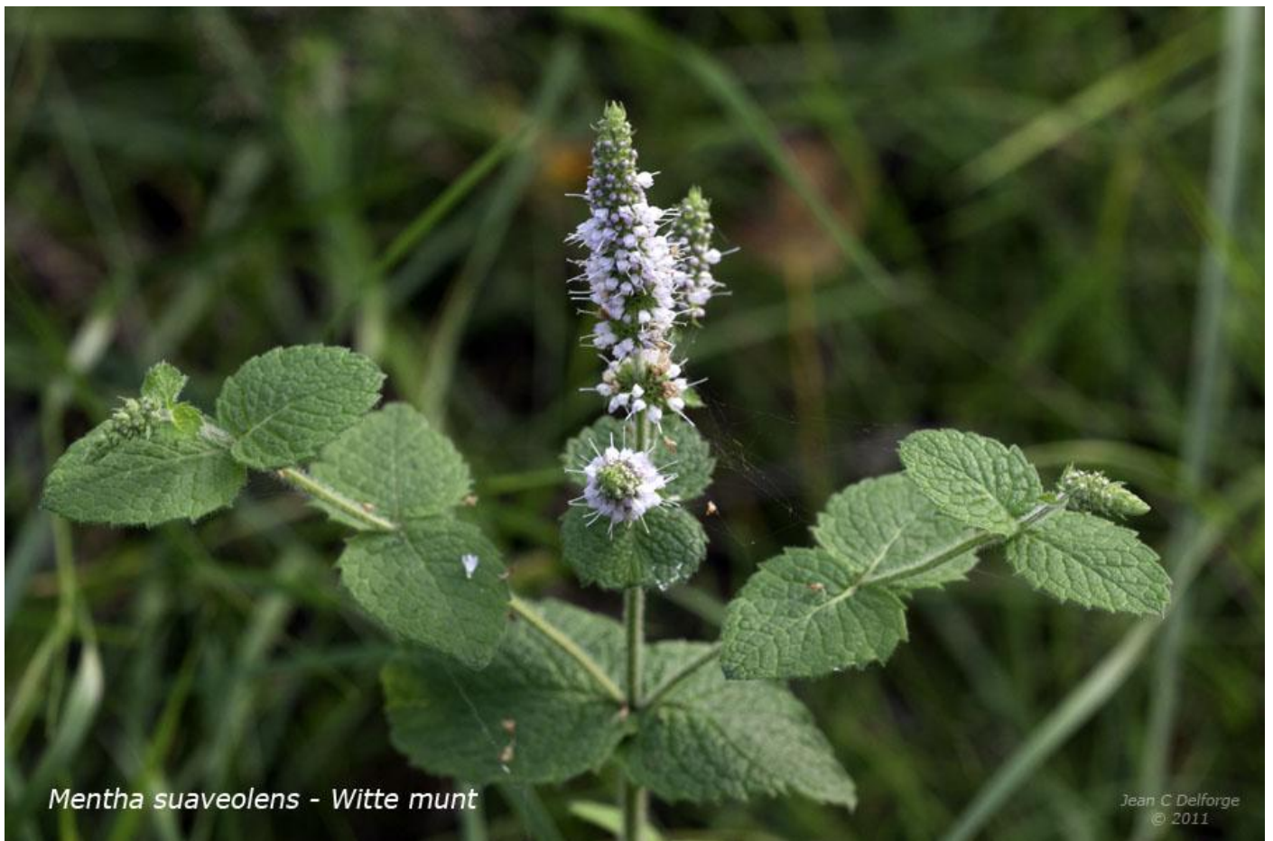
Mentha suaveolens - Witte munt