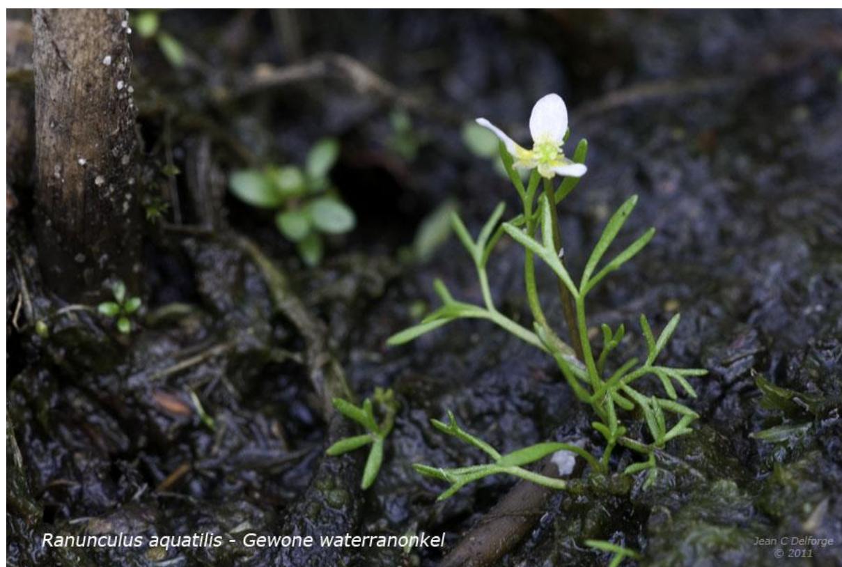
Ranunculus aquatilis - Gewone waterranonkel